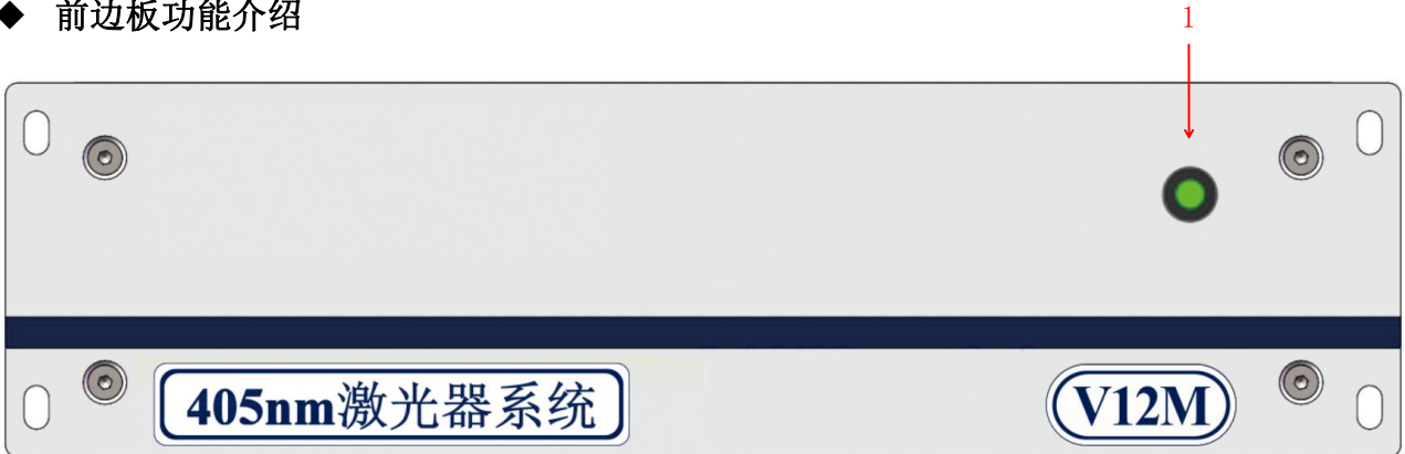
图 1 前面板