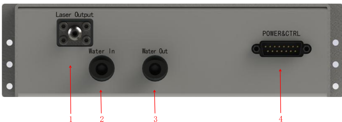
图 2 后面板